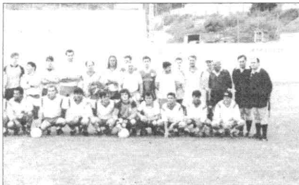
A célebre equipa de jornalistas que venceu os autarcas a 29 de Junho. Alguns deles vão jogar já neste sábado

Ao que sabemos, as equipas estão já em estágios prolongados, preparando ao máximo a competição. E porque, a concorrência na profissão já é notória, esperam-se algumas "caneladas